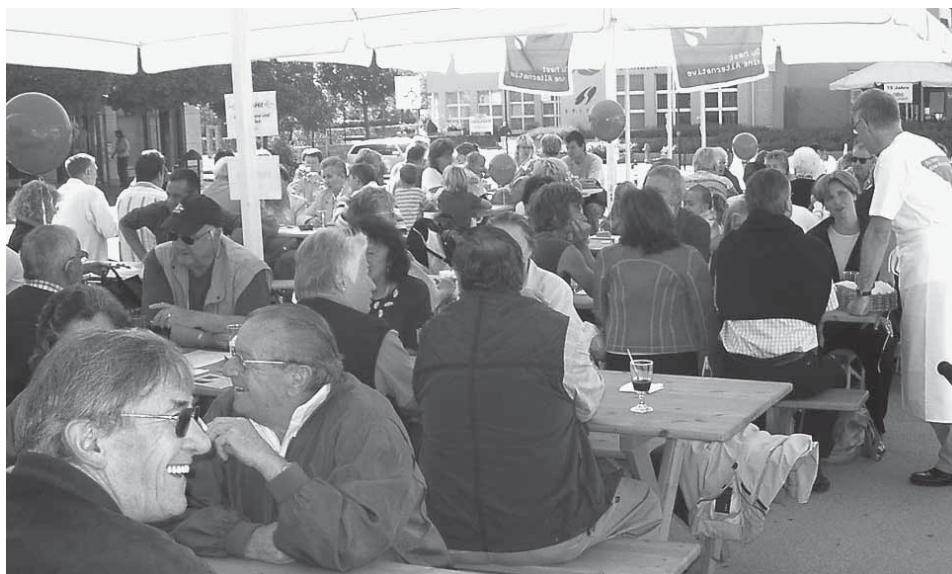
Gleis 3 feierte am 26. August 06 anlässlich des Dorfmarktes den 20. Geburtstag!

Die Schwerpunktthemen Sozial- und Familienpolitik sowie Umwelt, Verkehr und Bildung beschäftigten Gleis 3 in den letzten 20 Jahren stark. Gleis 3 spürt jeweils frühzeitig, was in Gesellschaft und Familien aktuell ist und reagiert darauf. In mehreren Vorstössen sowie Motionen und Interpellationen hat die Partei Anstoss zu vielen, heute nicht mehr wegzudenkenden Veränderungen in unserer Gemeinde gegeben: z.B. Motion Radweg Rotkreuz–Buonas (1986), Interpellation zur Kinderbetreuung (1994), Golfplatz (1996), Schulen Risch (1997) oder Wasserqualität Rischer Bäche (2004). Andere Vorstösse wie Planungszone Industrie (1990), Beruhigung Küntwilerstrasse, Label Energiestadt, erweiterte Blockzeiten und Bedarf Tagesschule fanden leider bei Gemeinderat oder Bevölkerung kein Gehör.